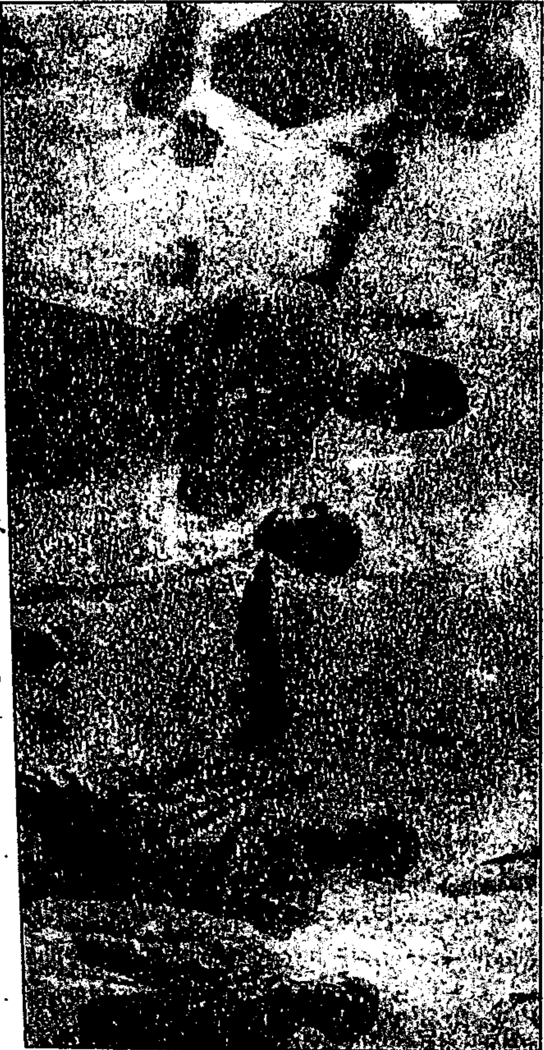
پہنت جی، بادشاہ خاں، سردار پٹیل، مولانا اور مہاتما گاندھی آل انڈیا کانگریس کمیٹی میٹنگ، دہلی ۱۹۴۷ء