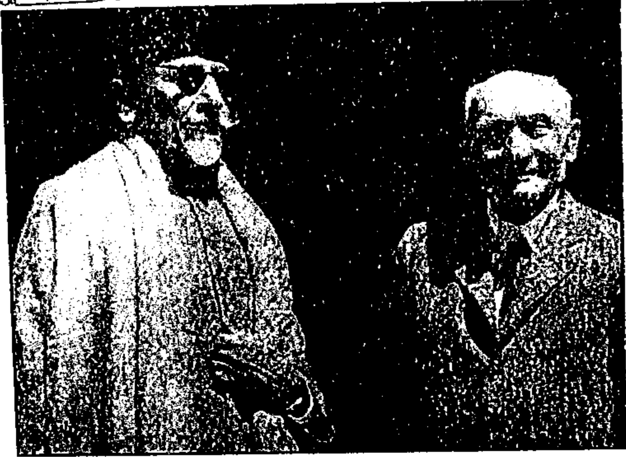
مولانا آزاد اور لارڈ پیتھک لارنس، ۵ مئی ۱۹۳۶ء