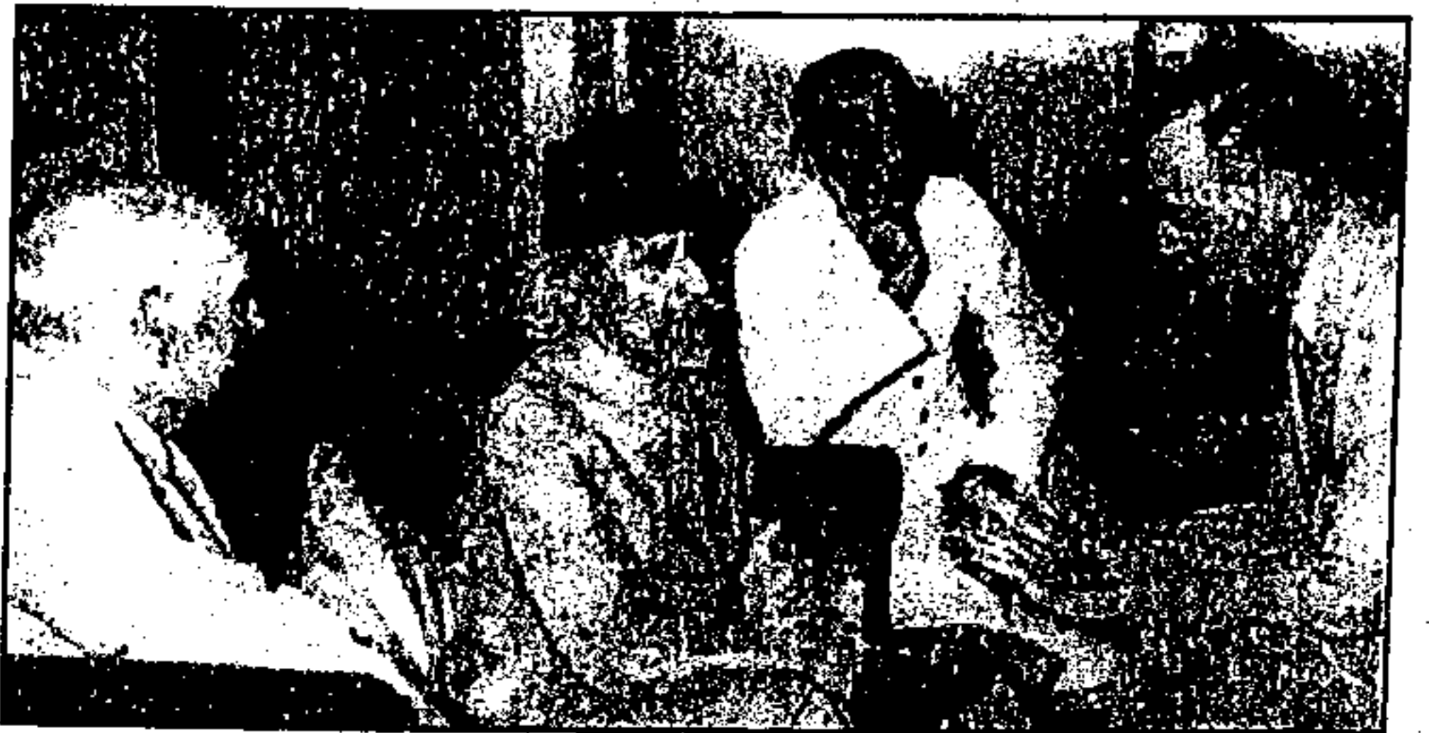
صدر کانگریس اور مسٹر آصف علی کینیٹ مشن سے ملاقات کرتے ہوئے دائیں سے بائیں: لارڈ پیتھک لارنس، مولانا آزاد، مسٹر آصف علی، مسٹر اے، وی، الیگزینڈر، سر سٹیوڈ کرپس۔