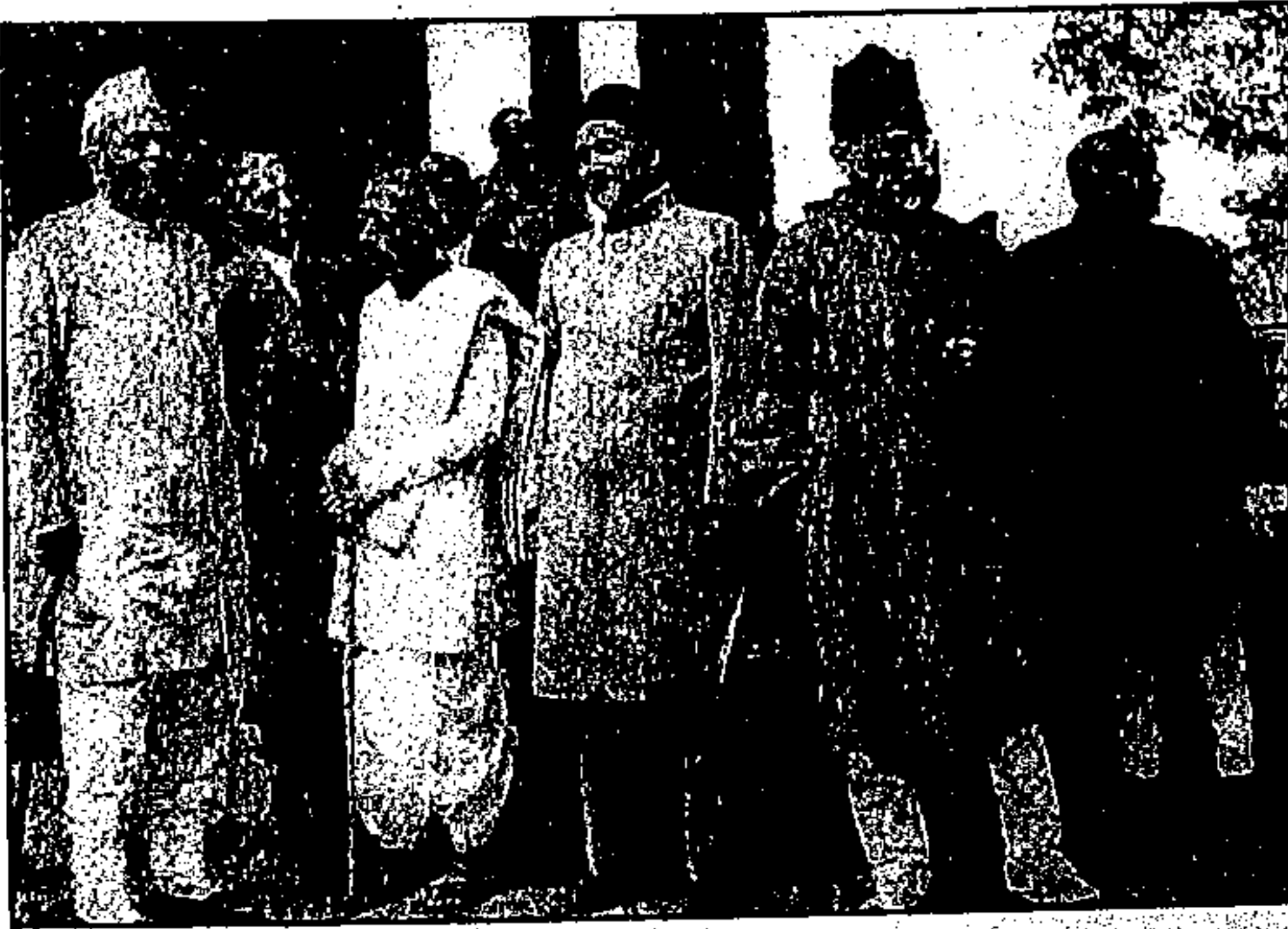
صدر کانگریس، مولانا آزاد، شملہ کانفرنس کے موقع پر، ۱۹۳۵ء