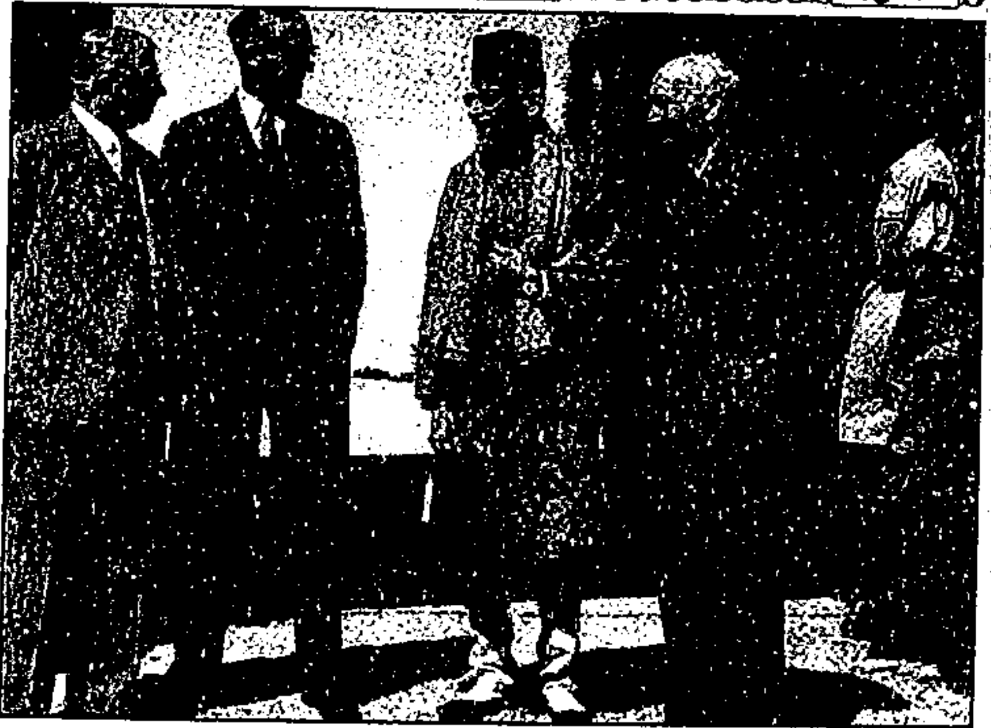
صدر کانگریس، مولانا آزاد، وانسریگل لاج پنچے ہوئے۔ بائیں سے دائیں: مسٹر اے، وی، الیگزینڈر، سر سٹیوڈ کرپس، مولانا آزاد، لارڈ پیتھک لارنس۔ ۵ مئی ۱۹۳۶ء