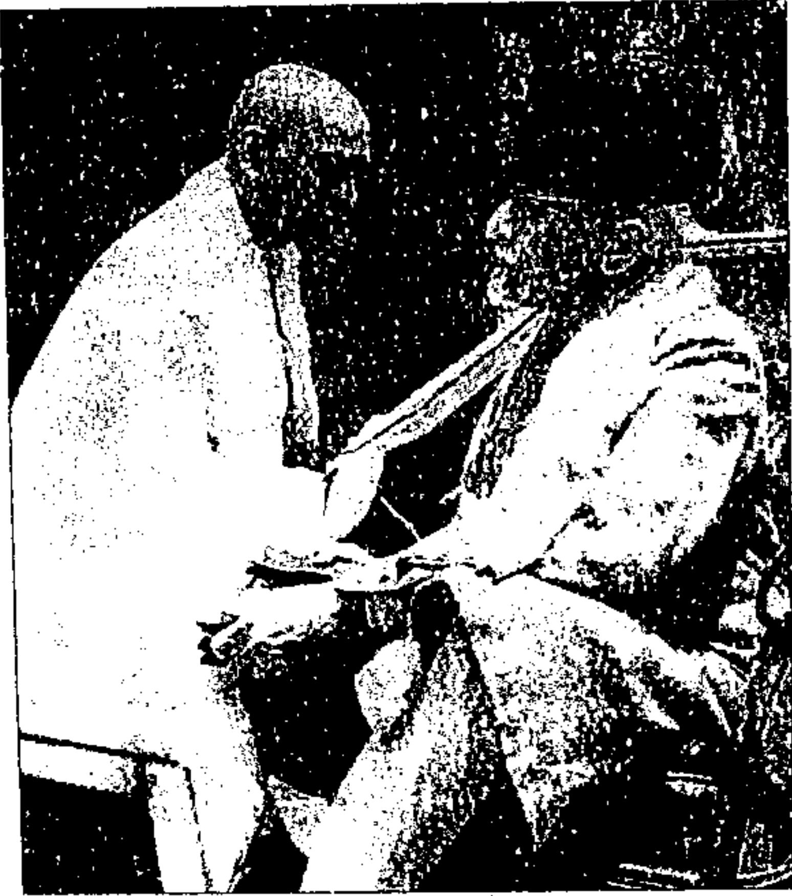
سردار پنیل مولانا آزاد کے ساتھ برطانوی کینٹ مشن کے دوران، ۱۹۳۶ء