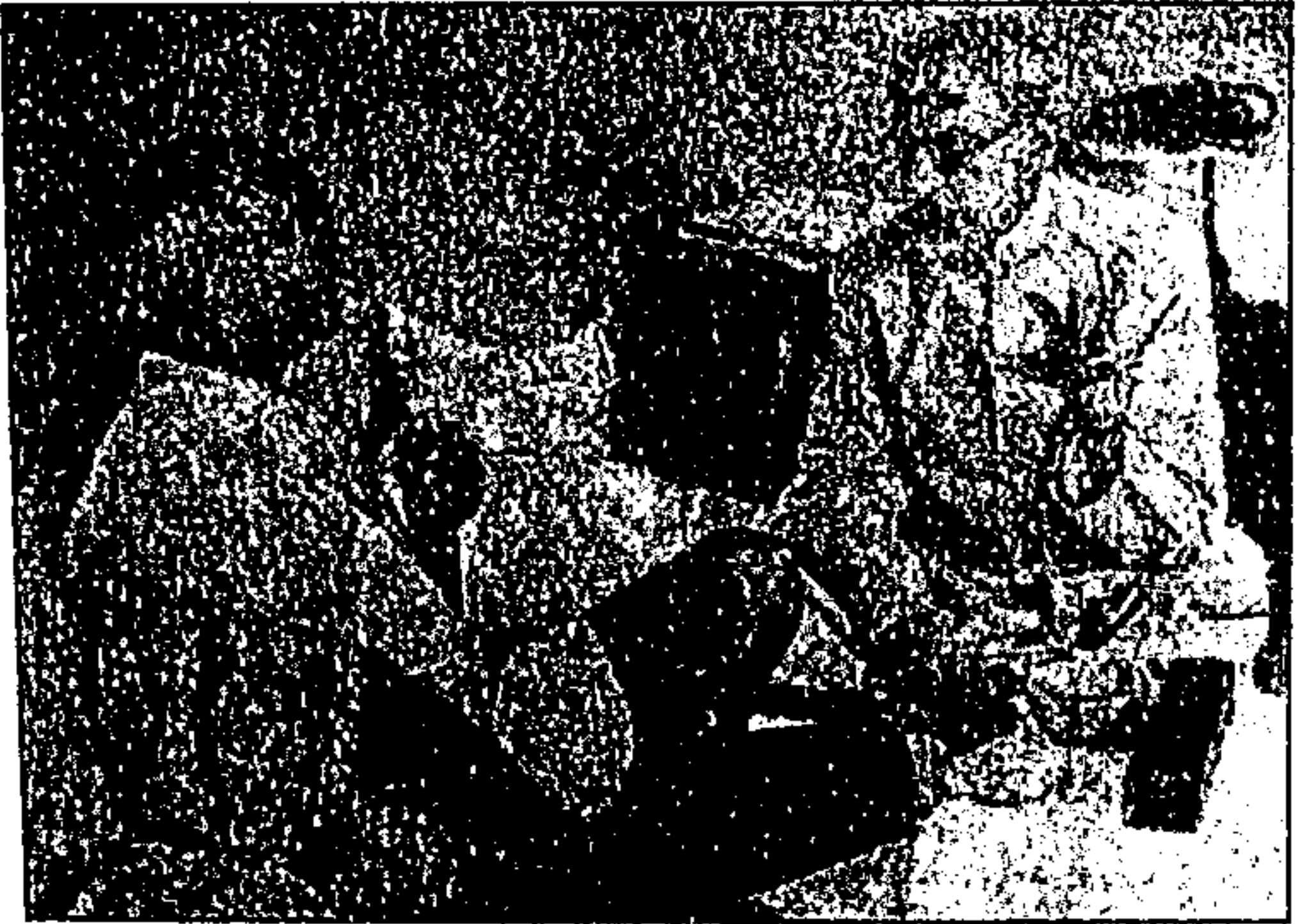
گاندھی جی اور مولانا ابوالکلام آزاد ۱۹۳۶