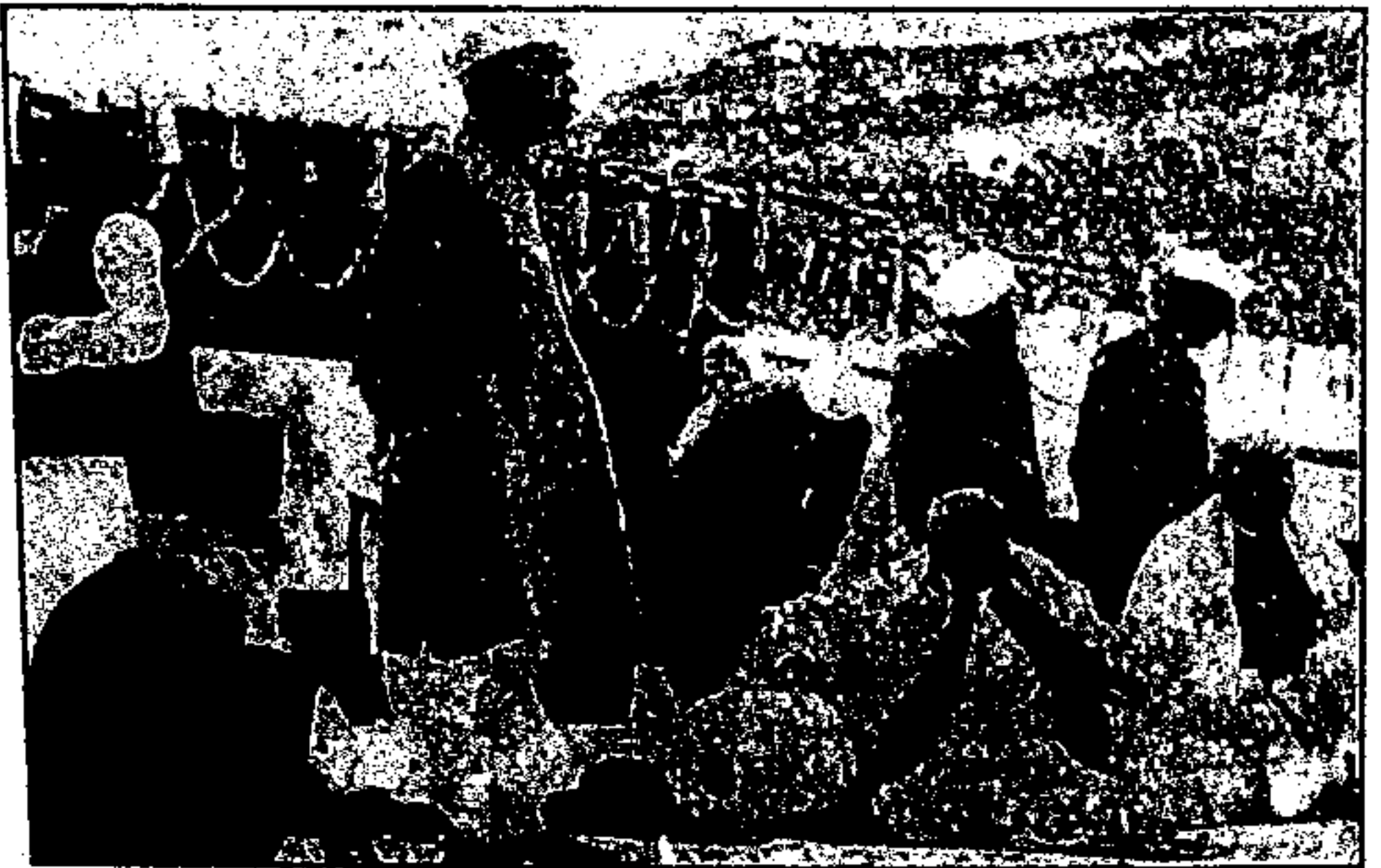
آزاد، شہر اور پنیل پبلیکس کمیٹی میٹنگ میں، انڈین نیشنل کانگریس کا ۵۵واں اجلاس، دسمبر ۱۹۳۸ء