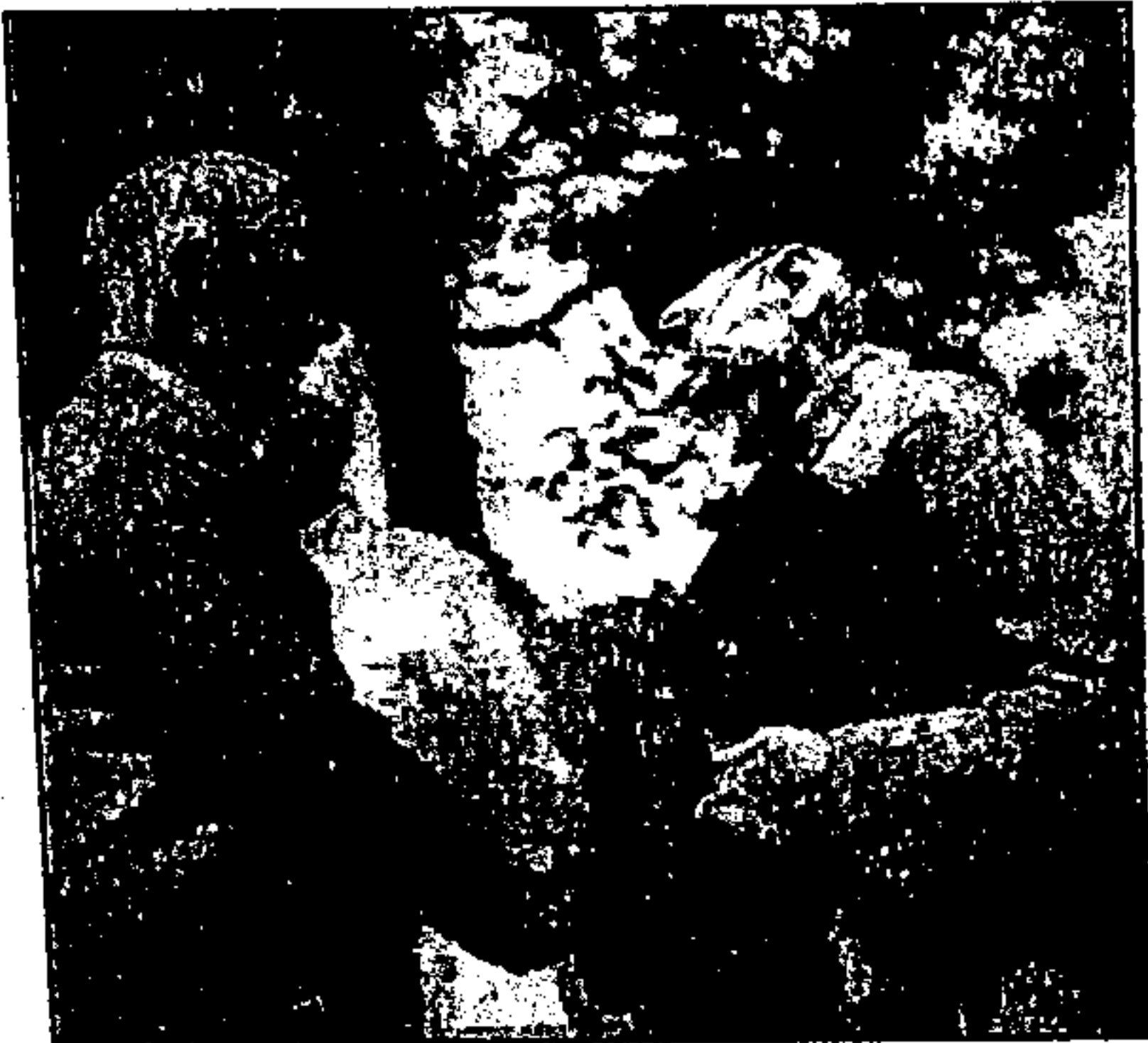
لارڈ ویویل، وائسرائے ہند کانفرنس کے افتتاح پر انڈین نیشنل کانگریس کے صدر سے مصافحہ کرتے ہوئے